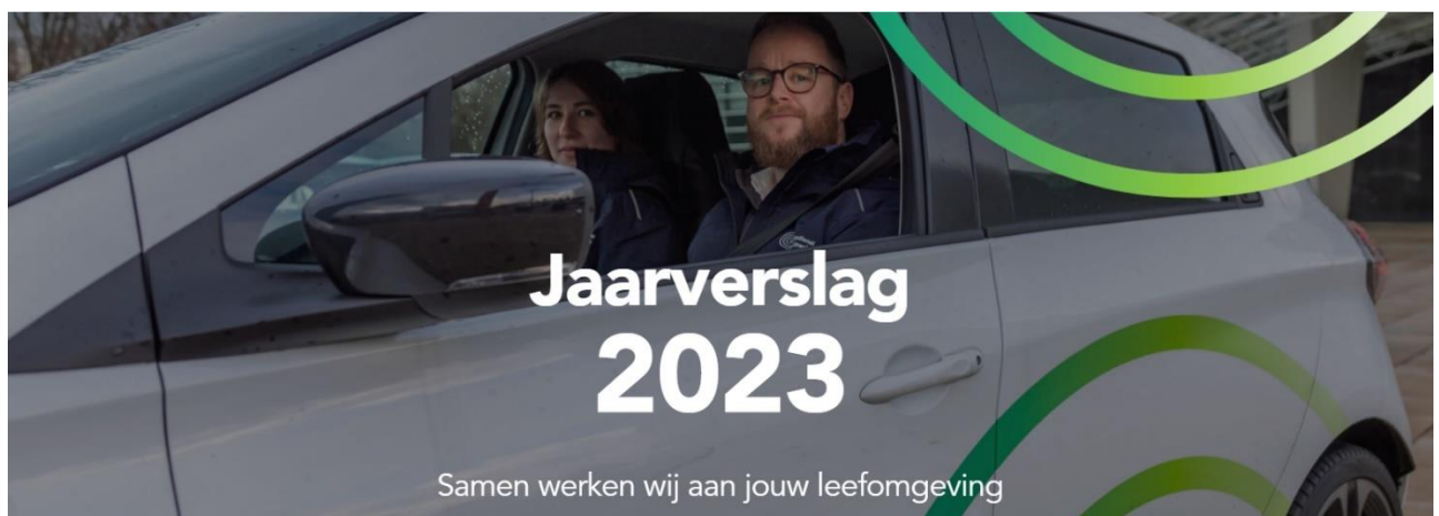
Figuur 1 - https://odru2023.jaarverslag.org/

In het jaarverslag wordt verantwoording afgelegd over de realisatie van de vooraf gestelde doelen zoals opgenomen in de begroting 2023. Wij zijn trots op onze inhoudelijke resultaten en willen u daarom een korte terugblik geven op 2023. U kunt het jaarverslag bekijken door op onderstaande afbeelding te klikken.